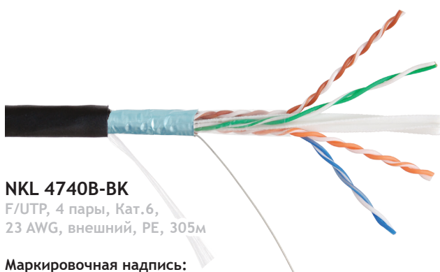
NKL 4740B-BK F/UTP, 4 пары, Кат.6, 23 AWG, внешний, PE, 305м

Маркировочная надпись: NIKOMAX NETWORK SOLUTIONS /// NIKOLAN NKL 4741B-BK F/UTP SOLID CABLE 4P CATEGORY 6 23AWG Class Fca PE OUTDOOR -60C ISO/IEC 11801 & EN 50173 & ANSI/TIA-568-C.2 NVP 0.67 (ZL) 1803 148M